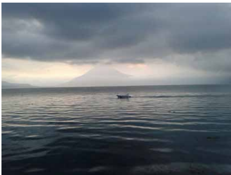
Atitlán, junio 2017.

De la capital de Guatemala hacia el oeste, a poco más de 100 Km. en el departamento de Sololá, se encuentra Atitlán, del que decía Aldous Huxley que es el lago “más bello del mundo”. Guatemala tiene un gran número de volcanes, muchos de ellos activos, es tierra de grandes temblores, el embalse se encuentra dentro de una cadena volcánica nombrada “Los Chocoyos”, en ella se encuentran los volcanes de Tolimán, San Pedro y Atitlán.