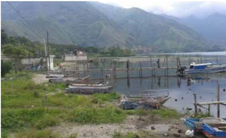
Orillas de San Juan la Laguna, junio 2017.

En esta villa es donde se tiene colocado el Filtro de reciclaje.