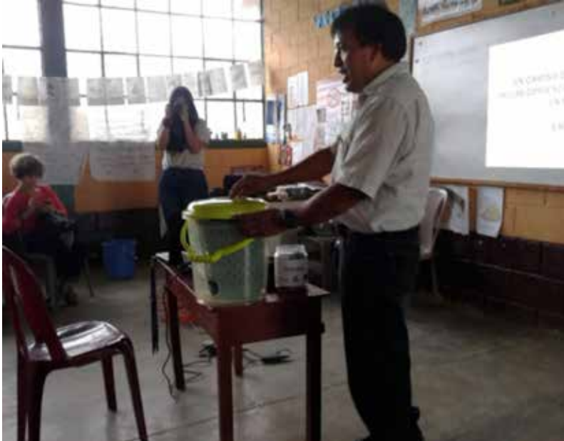
En Chuarixche, junio 2016.