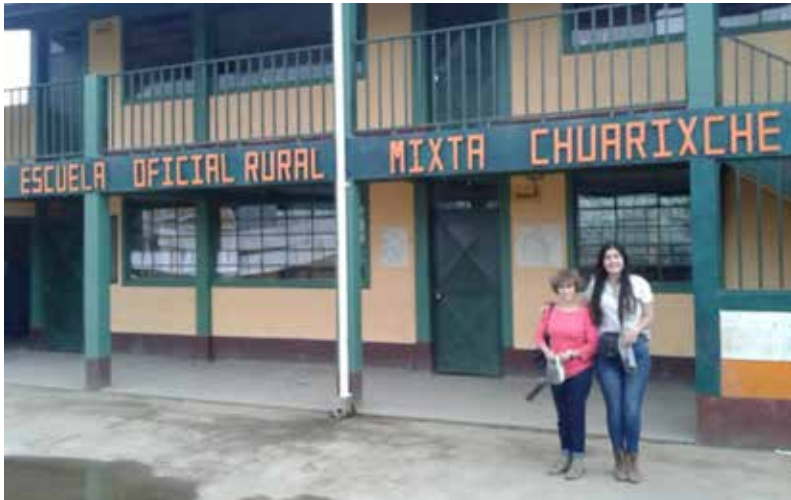
En Chuarixche, junio 2016.

Se trabajó también en la comunidad kakchiquel de Chuarixche, en la municipalidad de Sololá en lo alto de la cuenca, ya en la región de los bosques de niebla, donde se originan dos de los ríos más importantes que nutren al lago