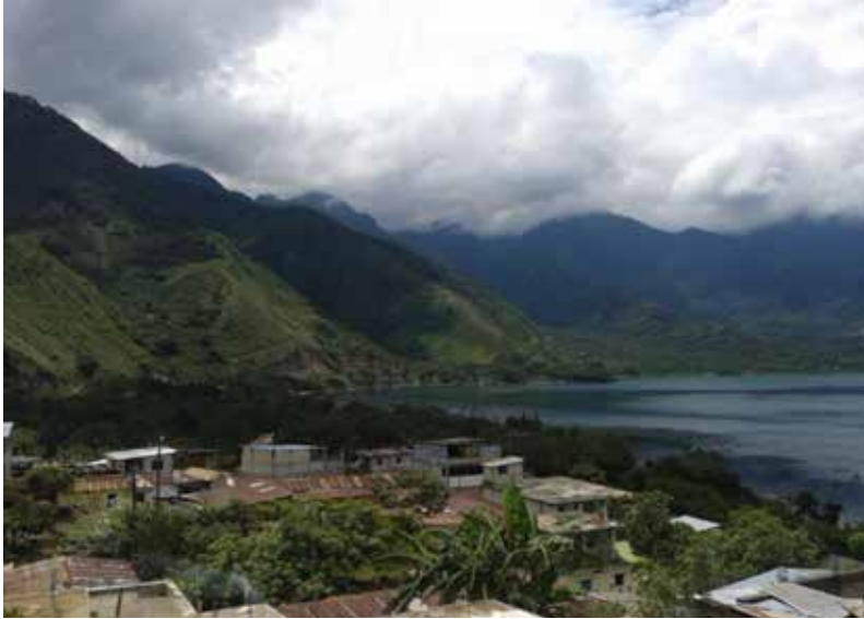
San Juan y San Pablo la Laguna, junio 2017.

de profundidad del lago o incluso más. La contaminación tiene como causas principales el crecimiento urbano no planificado, así como el manejo no controlado de los desechos, que son vertidos directamente en el lago o en sus afluentes.