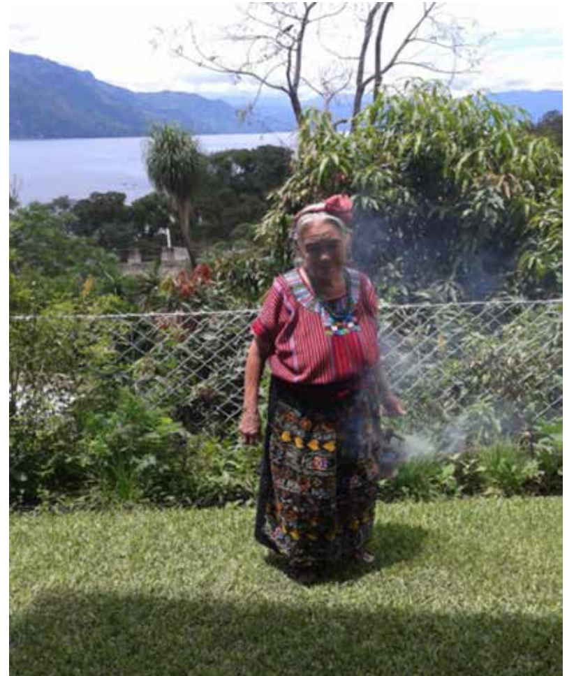
San Juan de la Laguna, junio 2017.

Sin embargo la palabra Atitlán, proviene del náhuatl y es la combinación de dos palabras en esta antigua habla indígena originaria de México: “Atl” quiere decir “Agua” y “Titlán” “en el lugar”. Por lo tanto, Atitlán significa entre las aguas. (Remí Simeón Ob.cit) La población ancestral sin lugar a dudas, está comprobado por los vestigios arqueológicos de pueblos y lugares de culto son mayas y los más antiguos que están bajo el agua del lago.