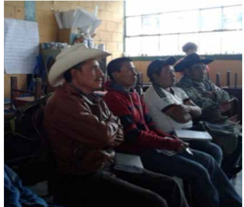
En Chuarixche, junio 2016.

En este lugar, por las dificultades del idioma, la explicación se llevó a cabo con el apoyo de la autoridad comunitaria para la traducción idiomática. Se explicaron las necesidades en torno al mantenimiento de la pureza acuática del lago, se mostró el proceso de funcionamiento del filtro y se dio una demostración de la composición por partes de cada material filtrante en su continente o cesto, de modo que quedará claro las partes y el orden de construcción del filtro FILAGREC. Las autoridades locales establecieron el compromiso de multiplicarlo para apoyar su propia producción de hortalizas, cultivos que han ido sustituyendo a los bosques de niebla en los terrenos planos.