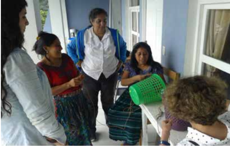
Realización de dos filtros. San Juan de la Laguna, junio 2016.

Se trabajó también en la comunidad kakchiquel de Chuarixche, en la municipalidad de Sololá en lo alto de la cuenca, ya en la región de los bosques de niebla, donde se originan dos de los ríos más importantes que nutren al lago